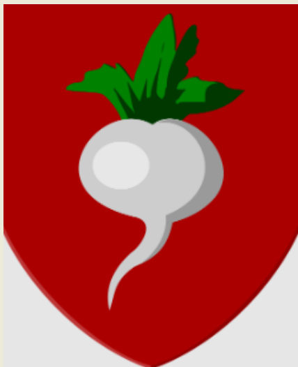
Wapenschild van het Waasland